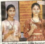
The highest women voter turnout was in Saharanpur at 64.22%

In the fifth phase, the women voter turnout percentage